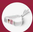
PULSERA MENORES SOLO TAPAS Y AGUA